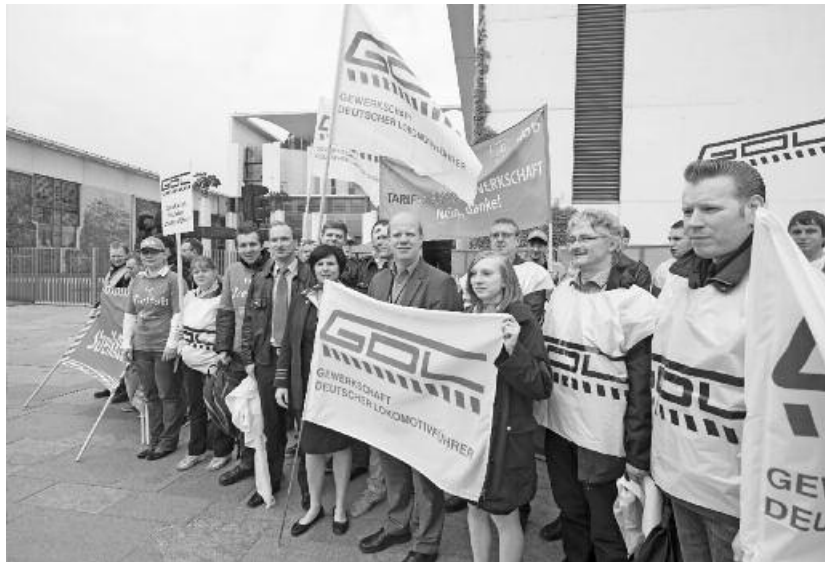
1. Mai 2014

Im Verhandlungsprotokoll zwischen Agv MoVe und GDL, das am